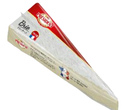
PRESIDENT ブリーチーズ 90g

特 長：ヨーロッパチーズNo.1ブランド「PRESIDENT」ブリーチーズはマイルドでミルクィな味わいが特長です。パンやクラッカーとともに楽しめます。