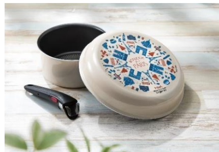
T-f a l パリ・コレクション