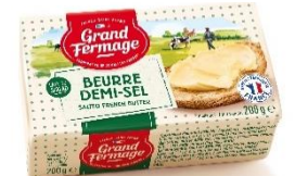
ユーリアル フランス産発酵バター（加塩）200g

特 長：豊かな風味や、まろやかなくちどけ、切れの良い後味、どれをとっても美食の国フランスならではの味わいが楽しめるバターです。分厚くスライスし、パンやパンケーキなどで味わいが楽しめます。