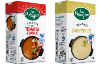
左) ラ・ポタジュールトマトとバジルのスープ 右) アスパラガススープ

価格：トマトとバジルのスープ 1,030g 本体398円（税込429.84円） アスパラガススープ 1,030g 本体498円（税込537.84円）