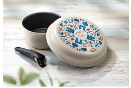
T-f a l パリ・コレクション