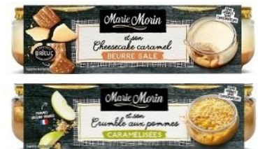
上) 塩バターキャラメル 下) キャラメリゼアップル on クランブル

価格：塩バターキャラメル 100g×2 本体1,480円（税込1,598.40円） キャラメリゼアップル on クランブル 130g×2 本体1,480円（税込1,598.40円）