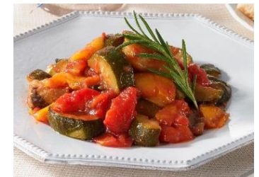
トップバリュ プロのひと品シリーズ 夏野菜のラタトゥイユ