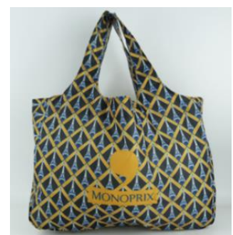
モノプリ エコバッグ