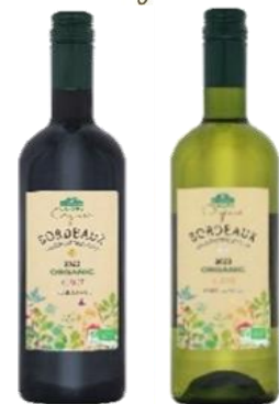
トップバリュ グリーンアイオーガニック オーガニック AOP ボルドー 左) ルージュ 右) ブラン