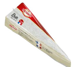
PRESIDENT ブリーチーズ 90g

特長：ヨーロッパチーズNo.1ブランド「PRESIDENT」ブリーチーズはマイルドでミルクィな味わいが特長です。パンやクラッカーとともに楽しみいただけます。