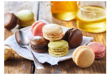
4種類のマカロン (チョコレート、フランボワーズ、バニラ、ピスタチオ)

高品質な冷凍食品としてフランスの国民に愛され、好きなブランドトップ10に毎年ランクインする人気ブランドです。添加物の使用をできる限り控え素材本来の味を生かし環境にも配慮した商品で、前菜からデザートまで、幅広く取り揃えています。冷凍状態で保存されているため長時間保存でき、作りたてのおいしさと食感を楽しむことができます。