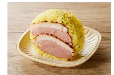
トップバリュ 合鴨のデミソースおにぎり

フランス・パリを中心に話題の「パリおにぎり」は、日本のおにぎりにパリならではの具材や味付けなどを組み合わせたアレンジグルメです。各メディアでも話題になるなど、日本国内でも関心が高まっているパリおにぎりを、トップバリュよりフランスフェア期間限定で販売します。