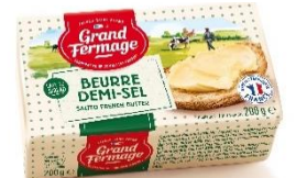
ユーリアル フランス産発酵バター（加塩）200g

特長：豊かな風味や、まろやかなくちどけ、切れの良い後味、どれをとっても美食の国フランスならではの味わいが楽しめるバターです。分厚くスライスし、パンやパンケーキなどで味わいが楽しめます。